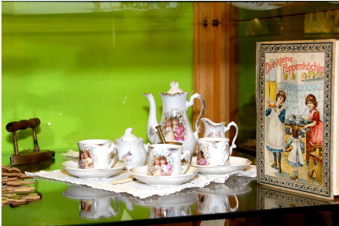
Puppenservice, Kinderbuch, Kinder-Bügeleisen (das wirklich erwärmt werden konnte)