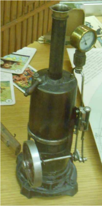
eine wirklich funktionierende Dampfmaschine