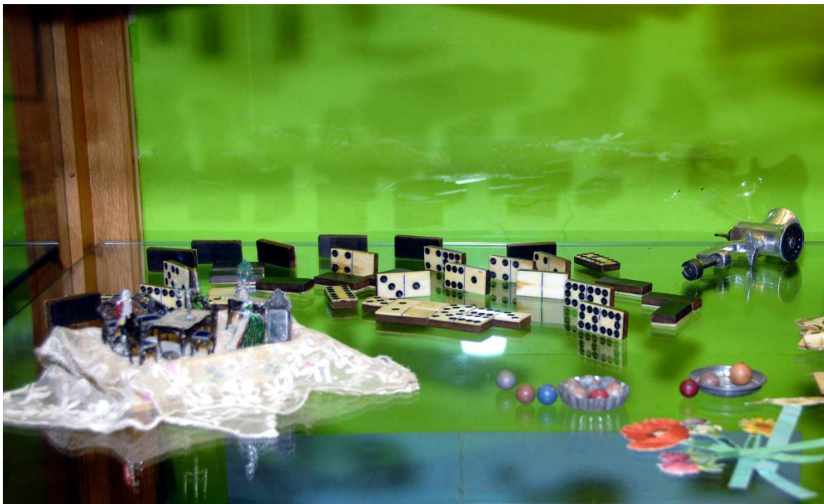
Puppenmöbel aus Zinn (etwa 1850), Dominosteine aus echtem Elfenbein, Tonkugeln, Papierblumen....