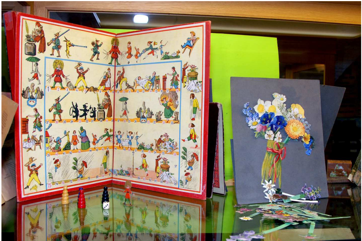
Struwwelpeter-Spiel: dazu musste man etwas auswendig lernen!