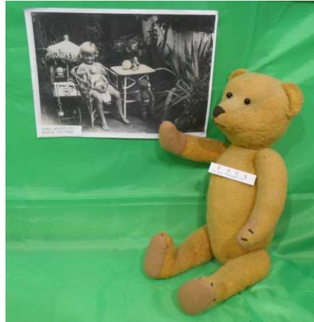
Und das ist der 90 Jahre alte Teddy mit einem Kinderfoto von Gerda,