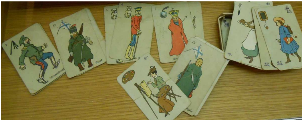
Eine Vorform vom „schwarzen Peter“