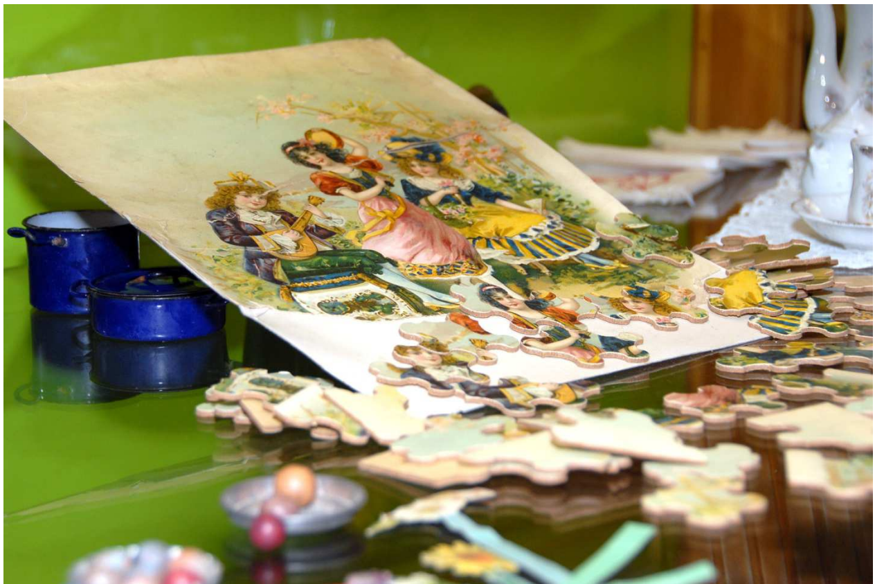
Puzzle (im Hintergrund emaillierte Puppentöpfe)