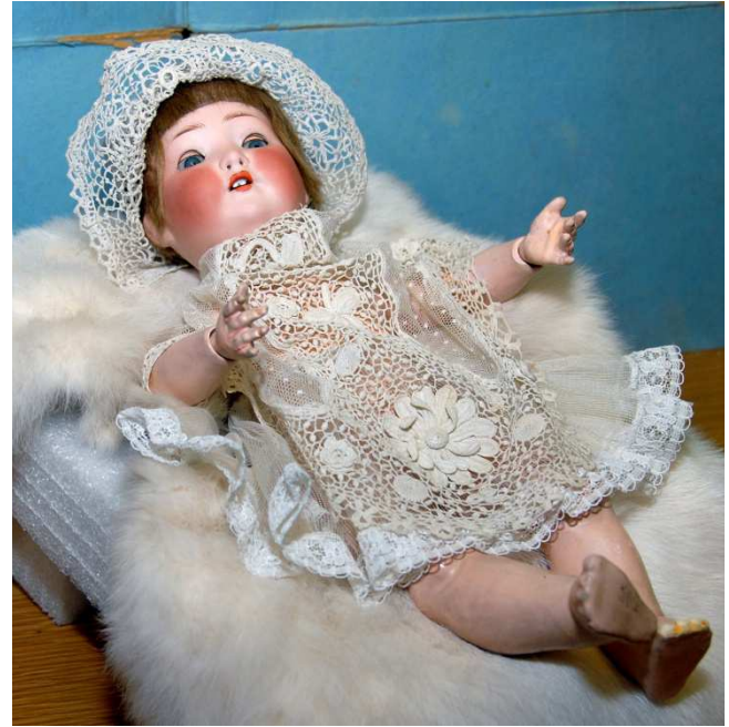
Eine „echte“ Windmühle ca. 1900, darunter Spielkarten Porzellanpuppe (um 1900) mit handgehäkelter Spitze