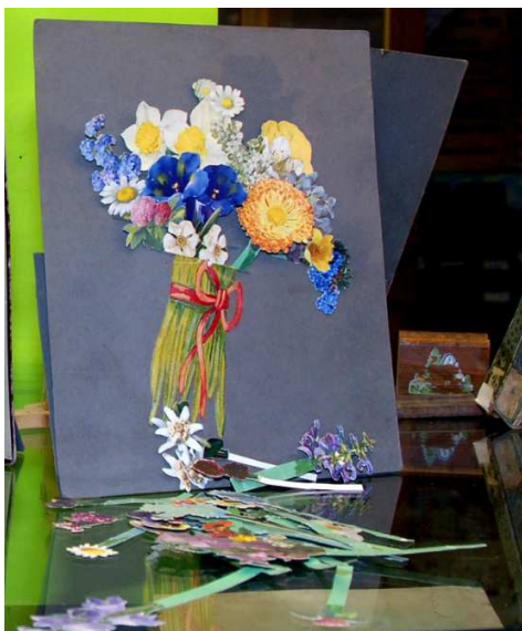
Papierblumen zum Arrangieren