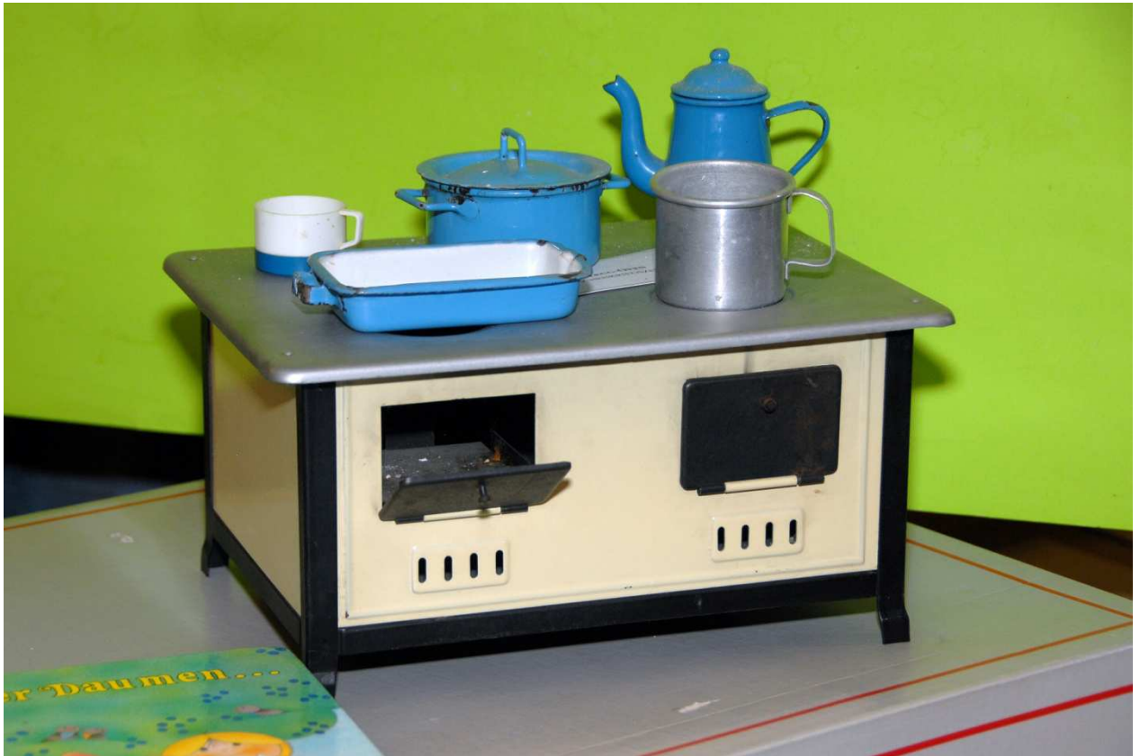
Puppenherd (oben) und Puppenstube (aus ca. 1930, um 1965 renoviert). Spende von Adelheid Viborny 5/2013