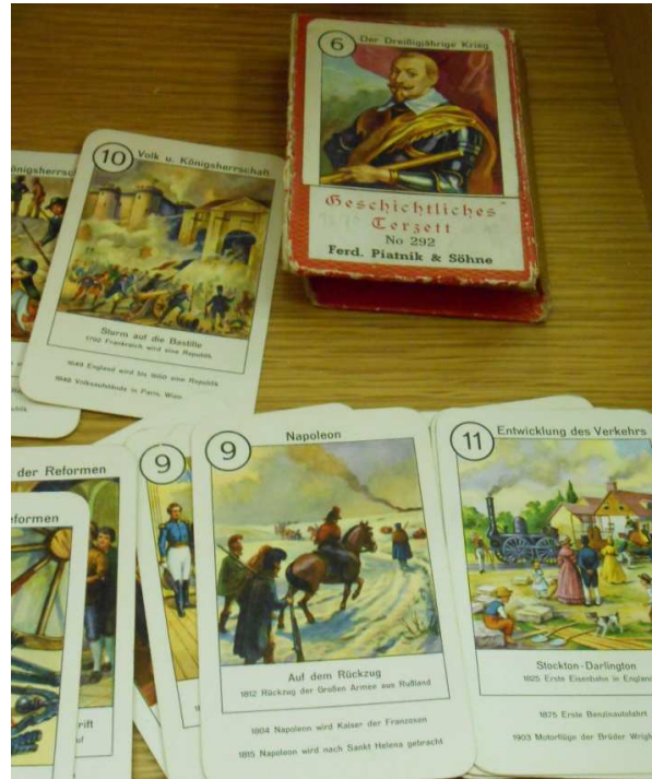
Das lehrreiche „geschichtliche Terzett“