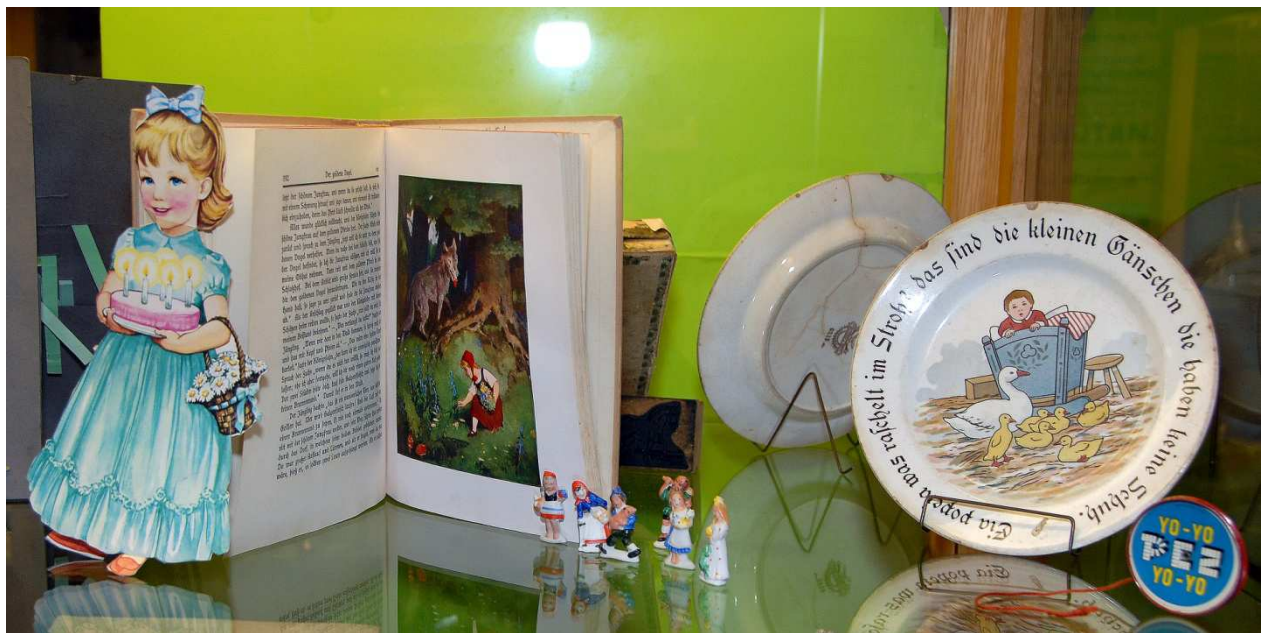
Ausschneidepuppe, Märchenbuch, Märchenfiguren, Kinderteller, „Pez“ als Jojo (Yo-Yo)